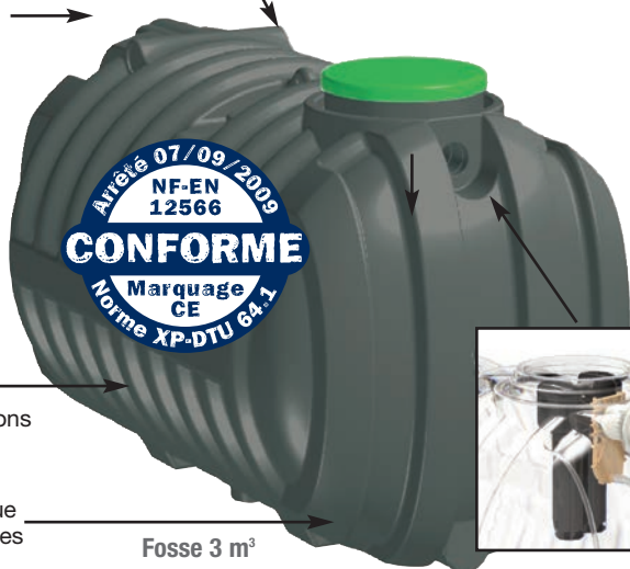
Fosse 3 m 3

Renfort des fonds pour résistance accrue par 4 poutres verticales